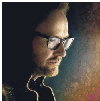
* Sigvart Dagsland.

Ei konsertoppleving med Sigvart Dagsland er eit møte med ein artist som beherskar publikumsrommet til fulle. Gjennom sin totale tilstedeværelse og uovertrufne stemme tar han mennesker med seg; frå det sårbare menneskelege til kraftfulle stemningar og vokalprestasjonar. Alltid med eit skrått og tidvis gapskrattande blick på tilværelsen sine mange fasettar. Alltid med ein djup respekt for dei band som bind artist og publikum, forteljar og lyttar saman. I bagasjen til Fosnavåg Konserthus 29. oktober har han låtar frå sitt nye album som kom 30.09., samt høg-